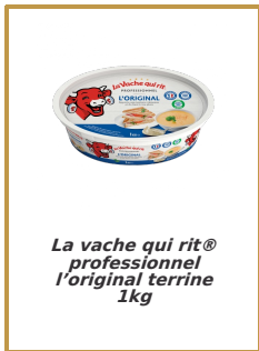
La vache qui rit® professionnel l'original 1kg